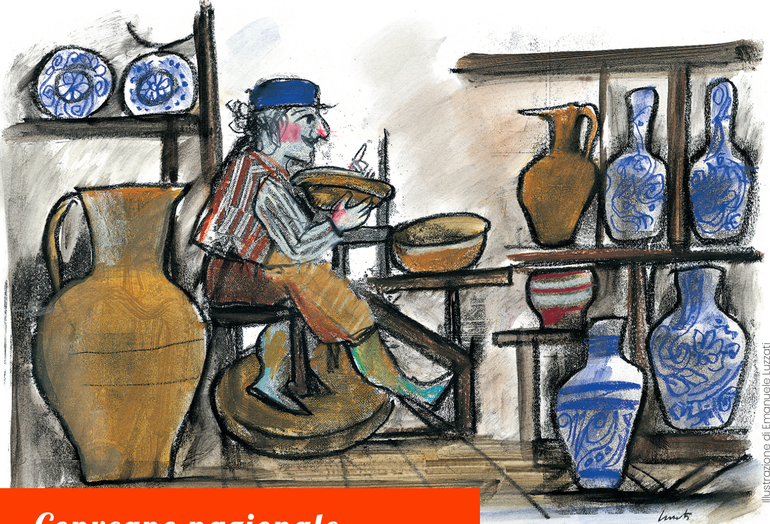
Illustrazione di Emanuele Luzatti